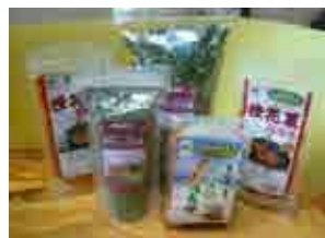
クワンソウ関連商品