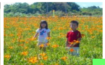
クワンソウ花摘み体験ツアー