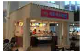
「ミルミル本舗」空港店