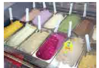
自家生産牛乳のジェラート