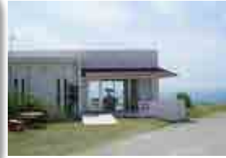
加工直売所「ミルミル本舗」

平成22年に牛乳加工生産施設・販売所の「ミルミル本舗」 を開業し、所得拡大と自社ブランド商品の創出を実現